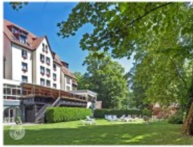
Hotel Verte Vallée